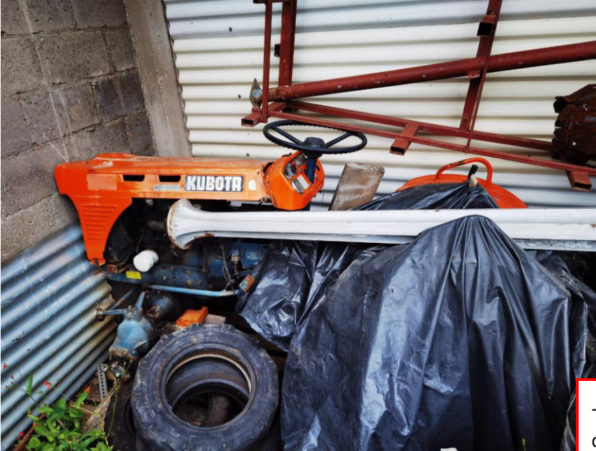
Tractor Kubota y Cortadora de Césped tipo carrito ubicados en el Cementerio General que se encuentran inutilizables