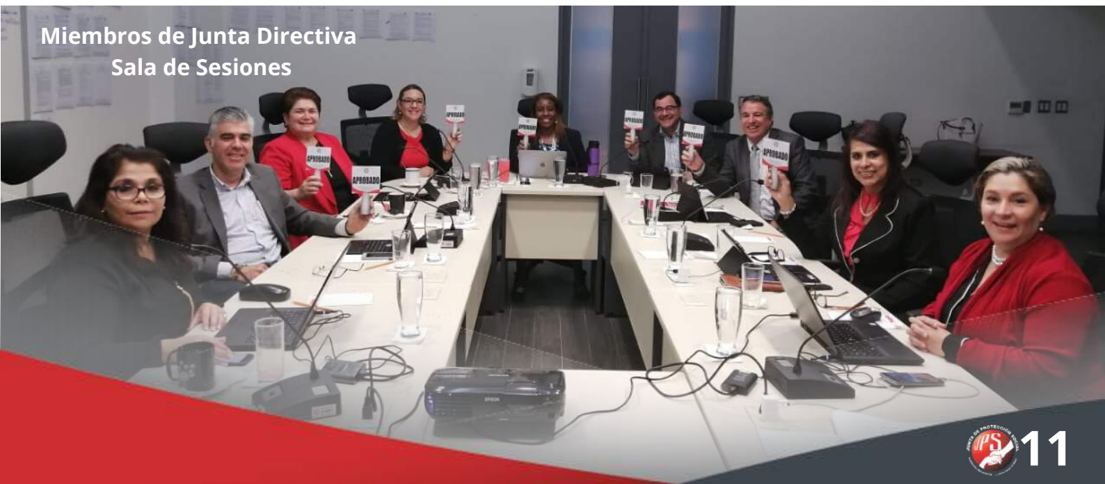
Miembros de Junta Directiva Sala de Sesiones

Datos : Departamento de Gestión Social y Secretaría de Actas.