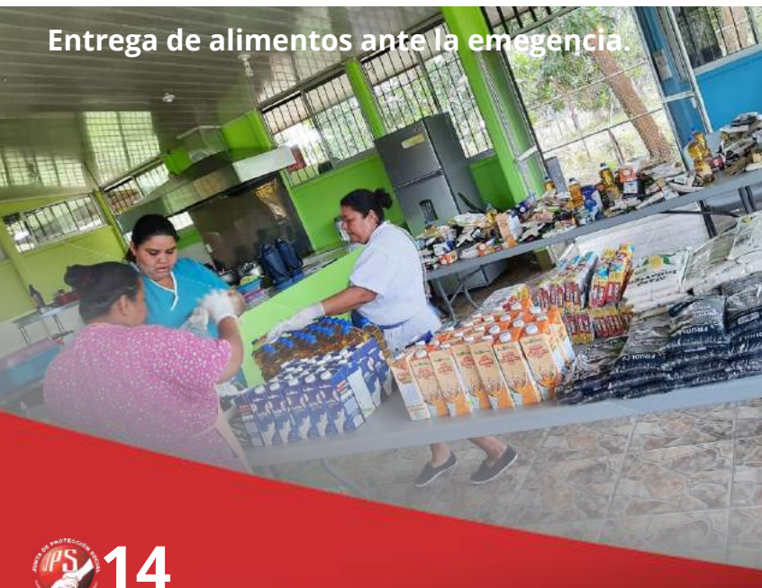
Entrega de alimentos ante la emergencia.

Se les dio autorización para gastos de transporte para los cuidadores y el traslado de los alimentos de una forma segura.